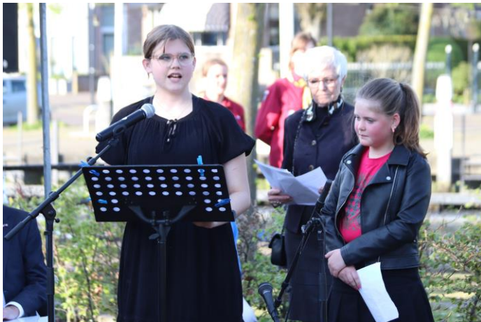
Leerlingen lezen gedichten voor bij het Joods Monument

Burgerschapsvorming is een vanzelfsprekend onderdeel van verschillende vak- en vormingsgebieden, zoals: Nederlandse taal, wereldoriëntatie (biologie, aardrijkskunde, geschiedenis, staatsinrichting, verkeer), lichamelijke, muzikale en sociale vorming. Daarnaast werken we aan burgerschapsvorming door de kinderen te laten samenwerken, om te gaan met vrijheid (in gebondenheid en in verbinding en relatie) en verantwoordelijkheid. Onze leerlingenraad met vertegenwoordigers van leerlingen uit groep 6 t/m 8 is een concreet voorbeeld hoe om te gaan met burgerschapsvorming. In KWINK!, onze methode voor sociaal emotioneel leren, wordt de verbinding gemaakt met de SLO doelen voor burgerschap. We hanteren een burgerschapsagenda waar activiteiten uit voortvloeien. Te denken valt aan Paarse Vrijdag, Wereld Klimaatdag en de herdenking van 4 mei.