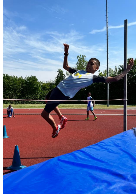
De lat ligt soms hoog