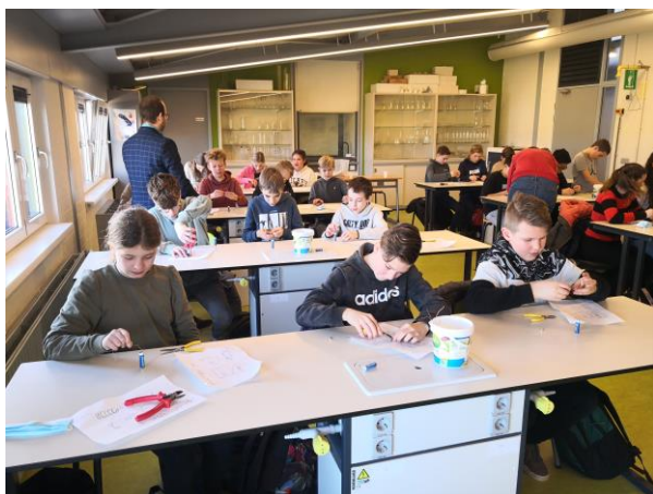
Kennismakingsdagen op het Hoeksch Lyceum

De inschrijving van de leerlingen bij het voortgezet onderwijs wordt vergezeld door ons definitieve advies. Dit advies wordt vooraf met ouders besproken. De school van het voortgezet onderwijs beslist of uw zoon/dochter al dan niet toegelaten wordt tot de gekozen leerweg.