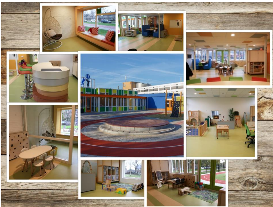
Sfeerimpressie Kinderopvang de Wereld op Centrum

Op IKC de Wereld op Centrum werken wij integraal samen met professionals die verantwoordelijk zijn voor de zorg aan onze (toekomstige) leerlingen. Door het ontschotten van de verschillende disciplines is een soepele en doorgaande lijn van kinderopvang naar school gegarandeerd.