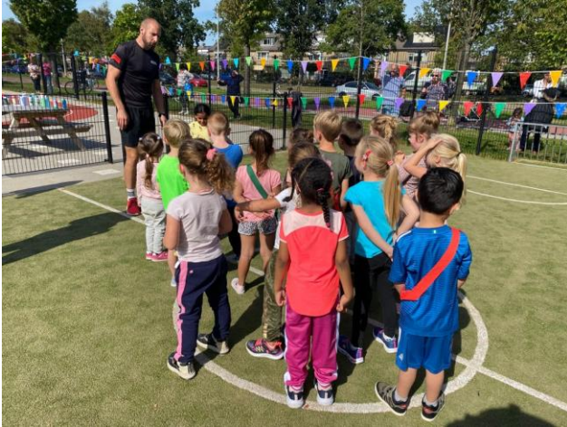
Ook naschools sportief samen zijn