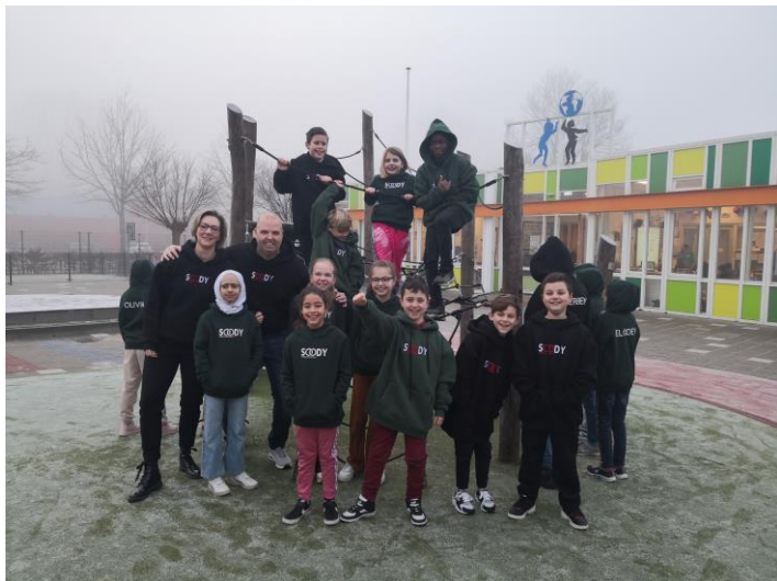
Een truidoneeractie leverde groep 6 een nieuwe hoody op

De scholen van Stichting De Hoeksche School ontvangen geen structurele inkomsten uit sponsoring. Incidenteel worden giften geaccepteerd mits daar geen tegenprestatie tegenover staat.