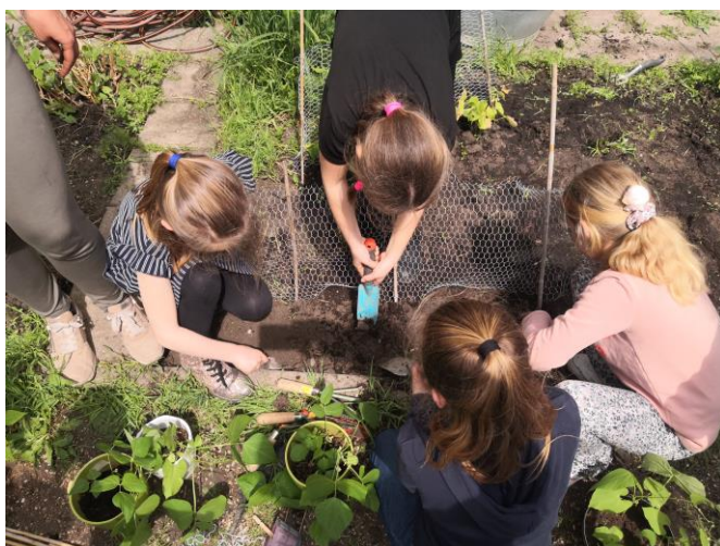
Moestuiniëren doen we nog niet digitaal

Zie hiervoor de bestuursgids op blz 17 e.v. bestuursgids HS