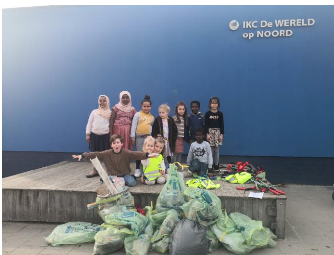
Onze leerlingen zijn afvalredders