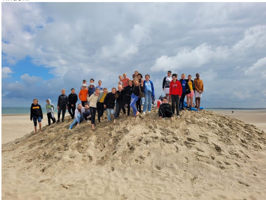
Kamp groep 8: om nooit te vergeten

Leerlingen krijgen geen toestemming om onder schooltijd deel te nemen aan kennismakingsactiviteiten in het voortgezet onderwijs. De basisschool kan wel met een volledige groep leerlingen naar een VO-school toe gaan om daar een activiteit uit te voeren. Activiteiten waar leerlingen individueel voor inschrijven, dienen buiten schooltijd om plaats te vinden.