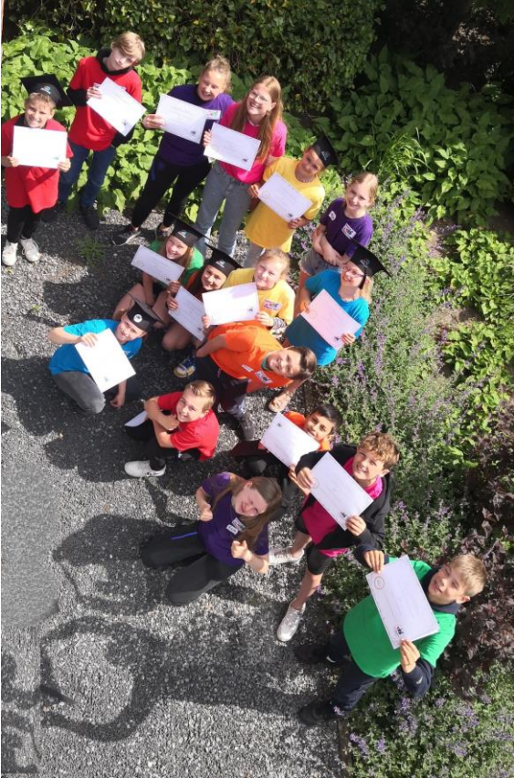
Kinderraad Hoeksche School '23

Op 20 november 2019- De Internationale Dag van de Rechten van het Kind - heeft Stichting De Hoeksche School de Kinderraad opgericht. Hierin leren kinderen wat ze willen met de wereld, wat ze willen in de wereld en wat ze willen met zichzelf. Ze denken na over hun relatie met andere mensen en met hun relatie met de natuur. Van zowel de Wereld op Noord als de Wereld op Centrum neemt een leerling uit groep 8 zitting in de Kinderraad. Onder leiding van vijf directeuren buigen ze zich twee keer per jaar over zelfgekozen thema's.